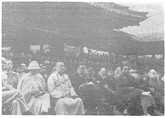
各國代表在京都本願寺觀劇