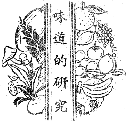
畫 鳴 淨 • 作 明 德

來舒去，變現許多的奇景，什麼山水人物，宮殿亭臺，萬狀千態，說之不盡。此世間的十彩電影，那能比的上萬分之一。天花飄飄颺颺，不住的降落，天樂鏗鏘鏘鏘，不住的演奏。花落處有色有香；樂過處有聲有韻。不似此間旅行坐車，坐船的枯悶，憑窗四望，無量無邊的花花世界，好似畫圖一般，都鋪在下面，千萬億里，一目了然。你在樓中若嫌着不盡興，這所樓房霎時就化去，就在你的坐下，現出一架七寶聚成的蓮花來，為你乘駕。這樣空空濶濶，任你縱目遊觀，每一個世界，願去一彈指的時間就能達到。若是遊玩足了興，不消伸臂之頃，又回到極樂世界來了。真是便利，真是自在！