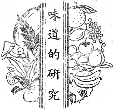
畫 鳴 淨 · 作 明 德 在 自 住 · 六

璫，作門作窗，金碧交輝，色光爭彩，各處嵌鑲赤珠，光華四射，好像百千日月，照耀虛空，複閣重樓，千門萬戶，高低掩映，層疊無盡。 室內几牀屏案，也是七寶所成。陳列在各方，好似萬花簇聚。蓋幔幢旛，皆是珠錦連綴；後空飄動，更像雲霞翻飛。要待需用器具，不用經營，一想就來；若要把他換去，不用搬移，一想自然就滅。 門前緊靠着水有八德的寶池，有時枯涸了，要想尋消遣，就把窗子打開，便得到逍遙自在。連檐的花樹，百狀千態，更發出種種的音響，配合上種種的鳥聲，池中蓮花，並放出微妙的香氣。這些景物，都送到你的面前，都任你去看，享受。無晝無夜，六時光明；不寒不暑，一年皆春。地不必掃，絕無半點灰塵；物不必洗，總是長時新鮮。