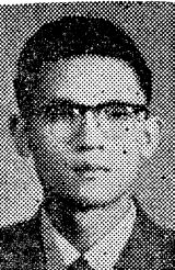
印、演兩師將出國講經 【臺北消息】印、演兩師，將出國講經，分別赴各該地宣揚佛理，講大乘經。

星此次返國觀光，並迎請章嘉大師舍利，多承諸山長老，教內大德，慈悲接待，高誼隆情，銘感五內！臨行匆促，慚未趨辭，謹此鳴謝，備乞亮察為幸！