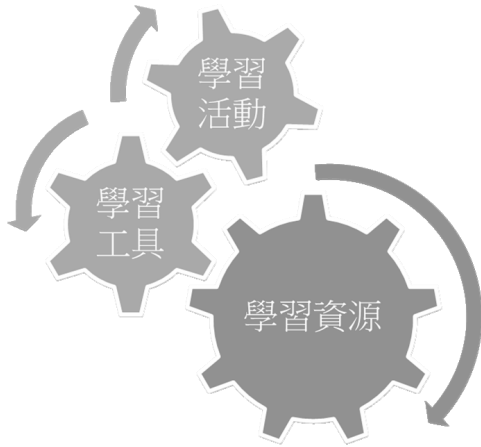
圖 1：數位學習發展角度

作，包括把佛教經典目錄整個重編。這些數位學習資源的建置，都是很有意義的工作和成果，相當於基礎建設，對於未來的影響是非常大的。