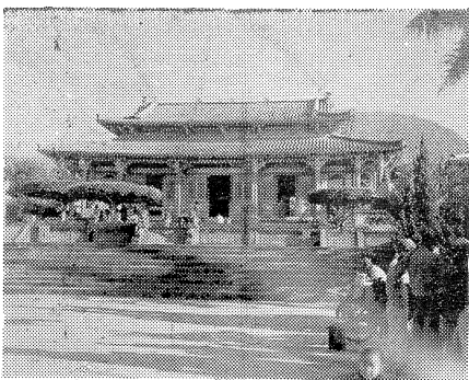
大仙寺全景