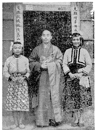
上為悟明法師及依三寶之 大公主及小公主

(高雄訊)此間慶芳書局頃印行六祖壇經一書，用三號楷書，每本定價二元，該局地址在高雄市五福四路一八〇號