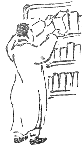
三、四分律所以獨盛之故

劉宋時，佛陀耶舍譯四分律。至唐代智首律師，作五部區分鈔。其弟子終南山道宣律師，體察衆生機緣，以四分律最爲適合；乃明其戒體，立其戒相，是爲律藏統一之始。(佛敎概論)