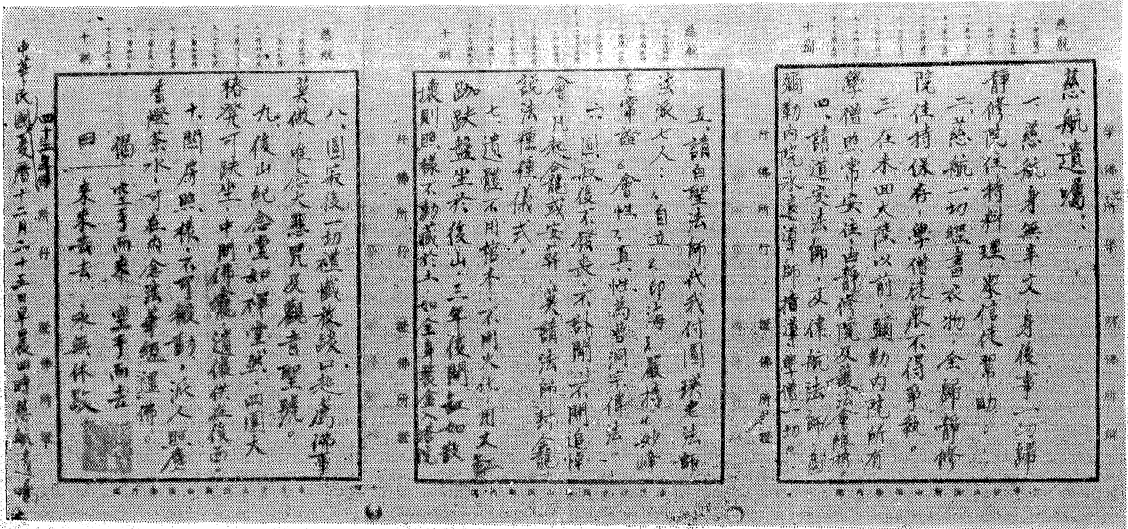
(左圖) 慈老親筆遺囑原文攝影