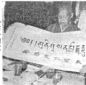
(右)圖三 (本刊記者特訊)本刊

接中佛會通知，悉日本曹洞宗管長高階瑞仙等一行七人，組織日本佛教使節團，訪問印度、錫蘭、泰國、緬甸、香港等處，於上月二十日將飛抵臺北松山機場，但僅作二小時之停留，即飛返日本云云，當由編者趕往臺北出席中佛會主辦之機場茶會歡迎。一行於下午九時降落，在機場餐室休息，始由