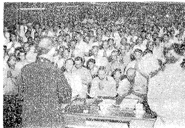
星雲法師在高雄佛教堂方便說飯依時