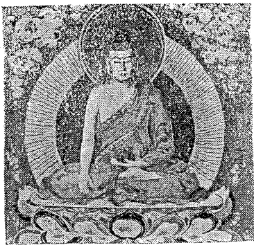
(該書封面設計水彩畫佛像)

七年他訪問印度，並在印度許下帶髮修行之願。從那一年起，他曾兩度利用康乃爾大學的假期間遊歷亞洲各地。柏特博士在這本新書內廣泛地選用佛教文學，企圖「把各教派的佛教思想作一公平的比較」。這部二四七頁的新書共分兩篇。第一篇收集佛教早期的作品。第二篇代表後期佛教的思想。柏特博士所加的評註對初初研究佛學的人們是非常有益的。註解內尚包括傳略和名詞淺釋等。