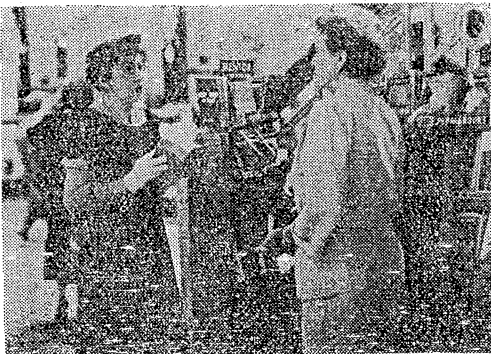
(該書暢銷美國書坊情形)