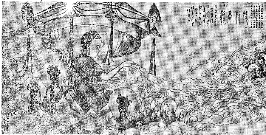
(劫祇僧阿邊無量無命壽民人其及佛陀彌阿)