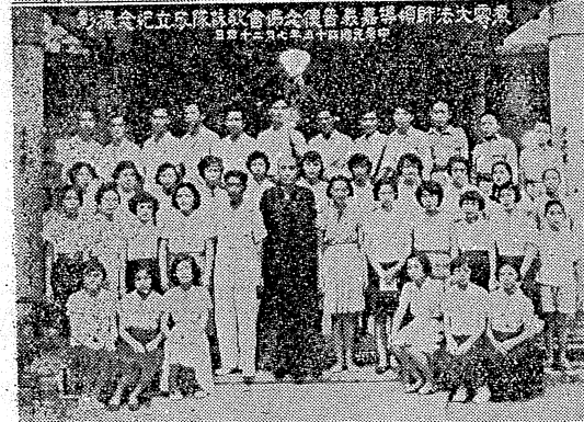
鳳山弘法團青年弘法團(上)北港弘法盛況(中)嘉義車站歡迎(下)嘉德普德堂歌詠隊

此間佛教弘法團，為弘揚佛法，特利用暑假期間，組織青年弘法團，分赴北港及嘉義兩地，進行弘法活動。該團成員，均為熱心佛法的青年，此次遠征，旨在將佛法普及於民間，並加強與各地佛教團體之聯繫。弘法團在北港及嘉義期間，曾舉行多場弘法講座，並參與各項佛教活動，深受當地信眾之歡迎。弘法團成員表示，此次遠征，不僅增進了對佛法的理解，也結識了許多志同道合的朋友。弘法團將於近日內返回鳳山，並將此次弘法活動之心得，整理成冊，供同好參考。